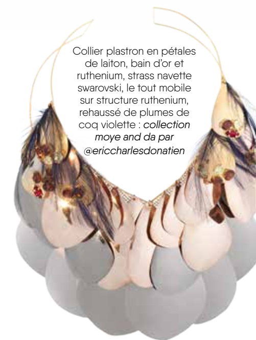
Collier plastron en pétales de laiton, bain d'or et ruthenium, strass navette swarovski, le tout mobile sur structure ruthenium, rehaussé de plumes de coq violette : collection moye and da par @ericcharlesdonatien