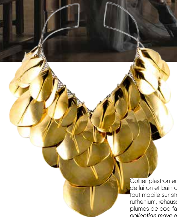
Collier plastron en pétales de laiton et bain d'or, le tout mobile sur structure ruthenium, rehaussé de plumes de coq fauve : collection moye and da par @ericcharlesdonatien