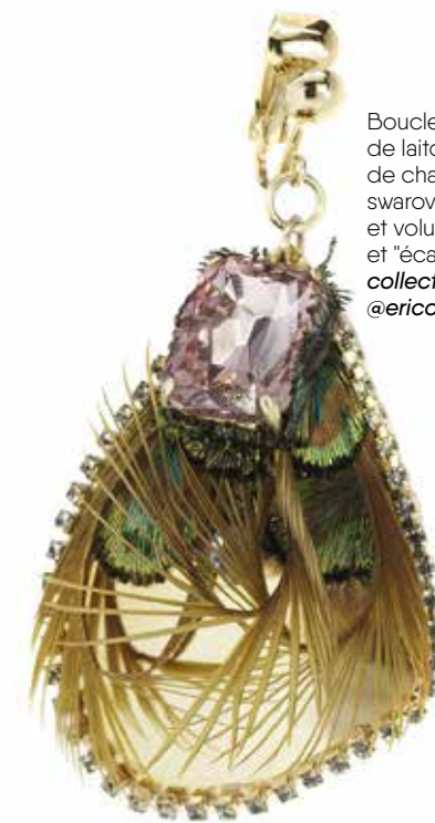
Boucles d'oreille en pétales de laiton et bain d'or bordé de chaîne strassée, cristal swarovski serti rectangle et volute de plumes d'oie et "écailles" de paon : collection moye and da par @ericcharlesdonatien.

J'essaie de concevoir mon travail dans une idée d'intemporalité. Je ne m'inscris pas dans une vision de mode actuelle, j'aime savoir que je crée pour un plaisir plus long que quelques saisons. J'aime travailler avec une valeur esthétique et qualitative pour créer des objets que l'on va chérir jusqu'à la fin de ses jours.