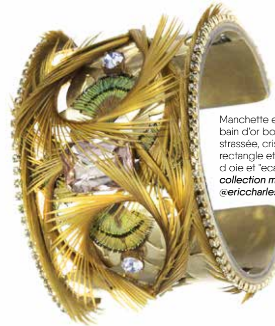
Manchette en laiton et bain d'or bordé de chaîne strassée, cristal swarovski serti rectangle et volute de plumes d'oie et "écailles" de paon : collection moye and da par @ericcharlesdonatien