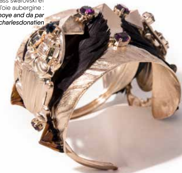
Manchette en plumes, scarabées et pyramide de laiton passé au bain d'or rose, strass swarovski et plumes d'oie aubergine : collection moye and da par @ericcharlesdonatien