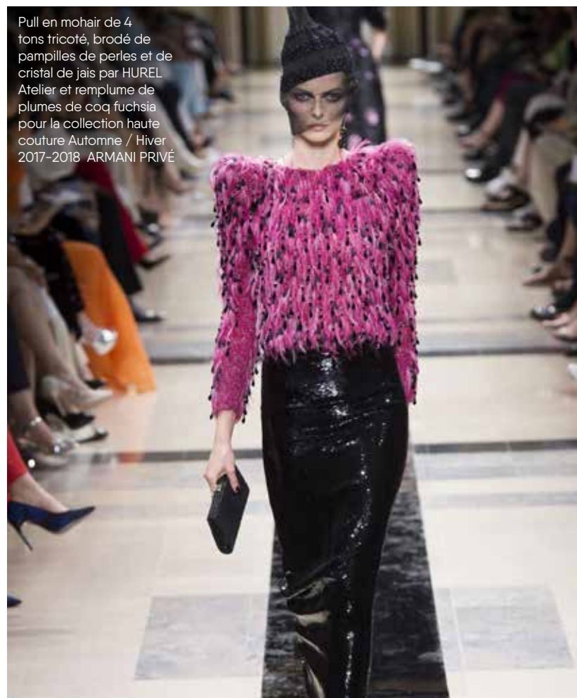
Pull en mohair de 4 tons tricoté, brodé de pampilles de perles et de cristal de jais par HUREL Atelier et remplume de plumes de coq fuchsia pour la collection haute couture Automne / Hiver 2017-2018 ARMANI PRIVÉ

Il y a certainement quelque chose à développer. L'ennoblissement, c'est le cœur de mon métier, les possibilités sont infinies. Tout passe par les personnes, une rencontre peut déboucher sur un projet intéressant. Je suis ouvert à toutes les formes de collaborations d'autant plus qu'il y a peu ou pas d'antécédents dans ce domaine.