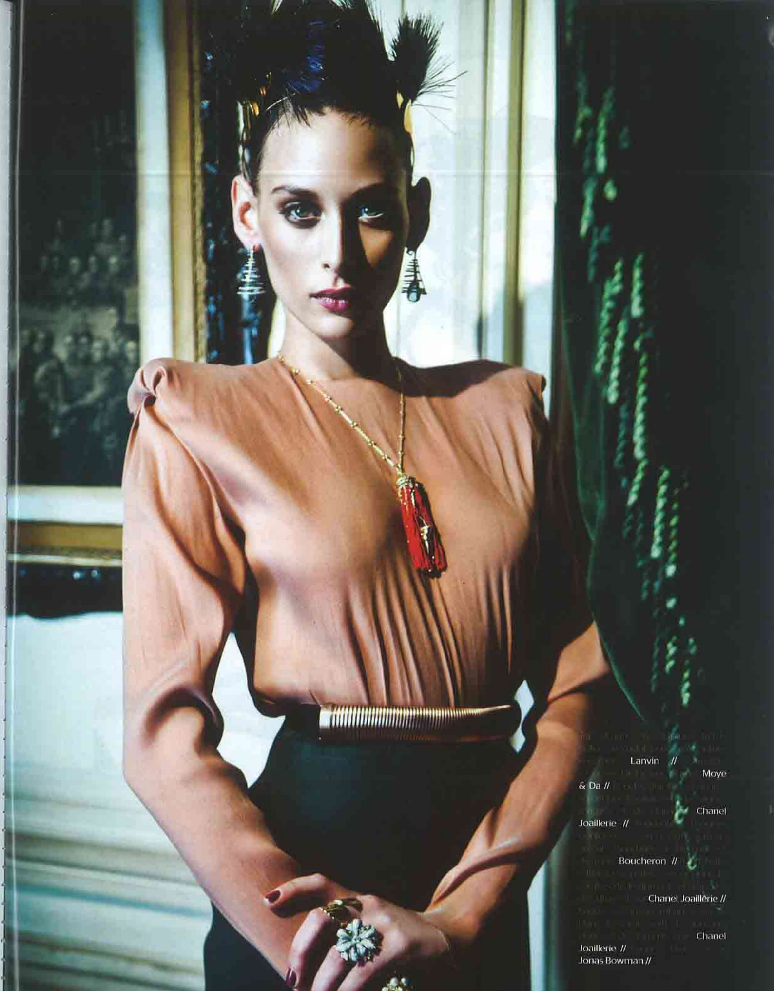
Lanvin // Moya // & Da // Chanel Joaillerie // Boucheron // Chanel Joaillerie // Chanel Joaillerie // Jonas Bowman //